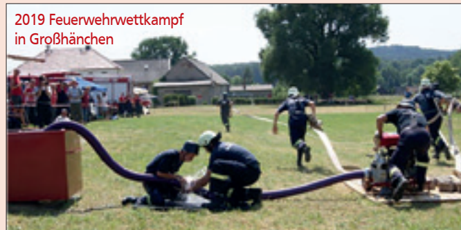
2019 Feuerwehrwettkampf in Großhänchen

Anschrift: FFW Drauschkowitz e.V., Zur Wasserburg 13, 02633 Drauschkowitz, freiwilligefeuwehrdrauschkowitz@gmx.de