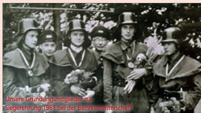
Unsere Gründungsmitglieder zur Siegerehrung 1961 bei der Bezirksmeisterschaft